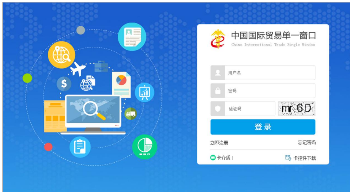
图 “单一窗口” 标准版登录

在图“单一窗口”标准版登录中输入已注册成功的用户名、密码与验证码，点击登录按钮。根据各地区提供的入口（例如下图中央标准应用），点击“服务贸易”选“暂时进出境货物”进入申请系统的界面。登录系统后，点击右上角“退出”字样，可安全退出系统。